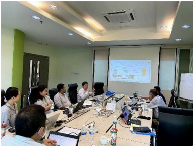
FUJI GLOBAL CHOCOLATE (M) SDN. BHD. (马来西亚) 公司的监督场景

每年都有计划地在国内及海外集团公司实施监督。2024年度，由地区统括公司不二制油株式会社的安全品质环境监督室安全品质环境监督小组对8处国内生产基地实施了监督。针对海外集团公司，根据上次的监督评估结果做好下次监督计划，2024年度对8处生产基地由生产效率推进小组实施了远程劳动安全卫生监督。在实施了监督的生产基地，对被要求改正的项目进行了改善后，还在确认进度的同时开展跟进工作。我们的目标是通过持续的推动监督、项目改正改善、跟进和监督循环，建设一个没有职业事故的工作场所。