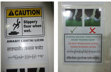
FUJI GLOBAL CHOCOLATE (M) SDN. BHD. (马来西亚) 的警示标示例