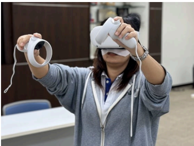
不二制油（泰国）有限公司体验 VR 设备（借用设备）。