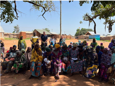
和Tebma-Kandu女性合作社的交流情况

总部设在华盛顿的国际食物政策研究所（IFPRI）也关注到了Tebma-Kandu项目活动，并决定在一定期间内参与该计划。这将为Tebma Kandu合作社改善效率和提高附加价值，提供创新的工具和物流手段，有望产生各种改善福利的效果。